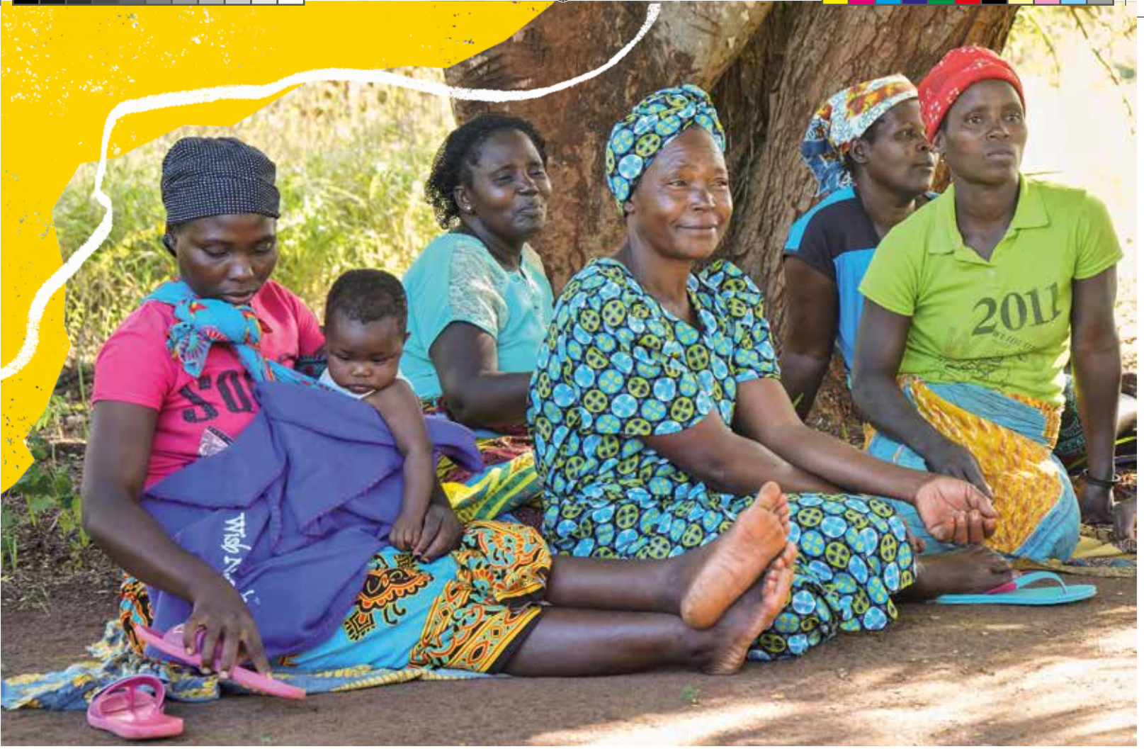
स्थानीय चर्च के नेतृत्व में, मोजाम्बिक में ये समुदाय के सदस्य अपने भूमि अधिकारों की वकालत कर रहे हैं।