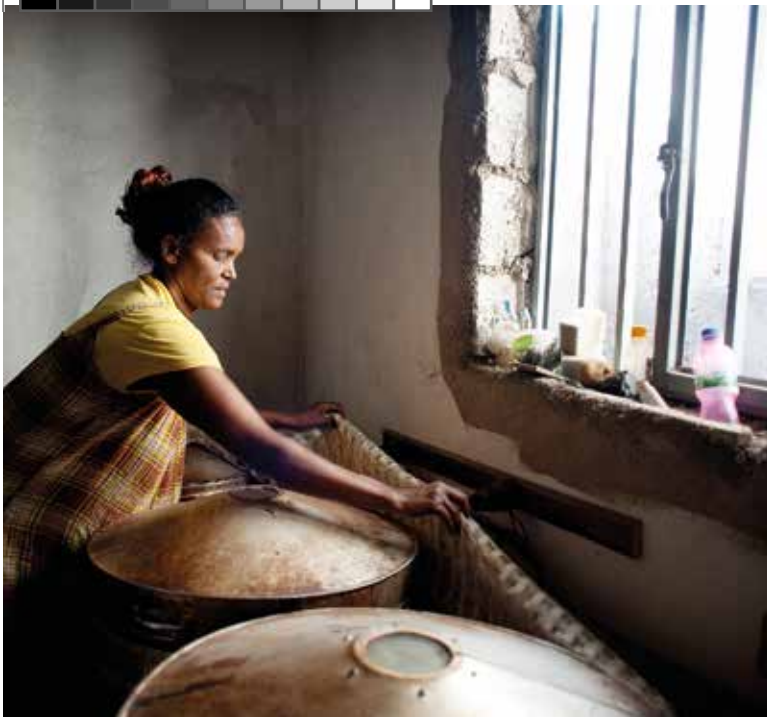
❑ इस इथियोपियाई बेकर ने अपने व्यवसाय का विस्तार करने के लिए अपने स्वयं सहायता समूह के छोटे ऋणों का उपयोग किया है।