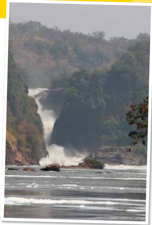
☐ न्याय को नदी के समान और, धर्म को महानद के समान बहने दो! (आमोस 5:24)।

बाइबल स्पष्ट करती है कि मसीहियों को न्याय के लिए परमेश्वर के उत्साह को साझा करना चाहिए। इसका अर्थ केवल अच्छा जीवन जीने की कोशिश करना नहीं है। हमें अपने समाज में जो गलत है उसे बदलने की भी कोशिश करनी चाहिए। यह प्रार्थना, व्यावहारिक देखभाल या अन्याय के विरुद्ध बोलने के माध्यम से हो सकता है। अक्सर यह इन सभी का संयोजन होगा।