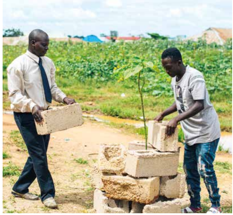
उदाहरण के लिए अग्रणी: टीयरफंड का भागीदार स्टाफ एक नए लगाए गए पेड़ की रक्षा करता है।