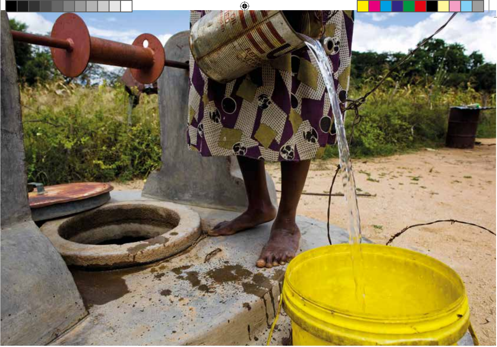
☐ सामुदायिक चैंपियन पानी जैसी सेवाओं के बारे में जानकारी इकट्ठा करने के लिए घरों में जाते हैं।